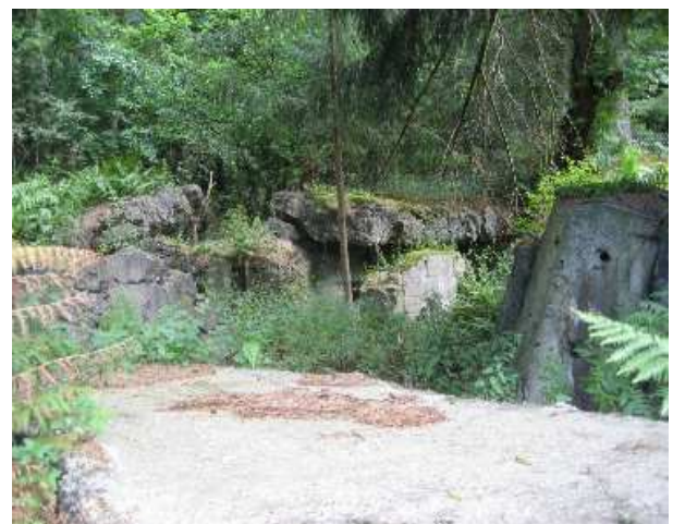
Blick ins Innere